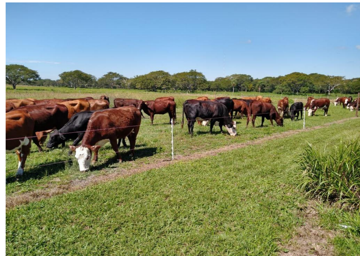
Figura 1. Parcelas de líneas de Paspalum notatum bajo pastoreo.

La línea L37 se presenta con un potencial nuevo cultivar para la especie.